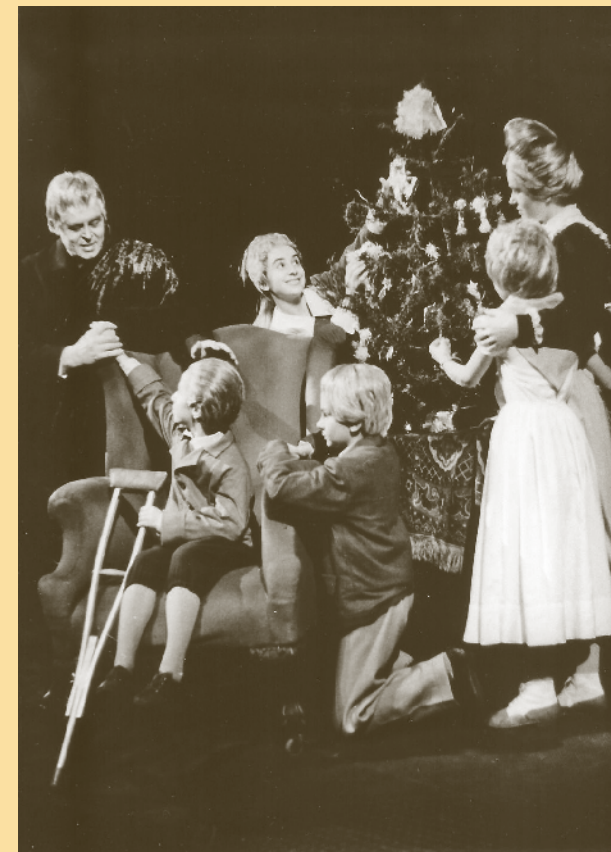
Bratislavská premiéra opery Mister Scrooge, 30. november 1963

Jeho dielo zasahuje takmer do všetkých žánrov. Základ však tvoria opery, ku ktorým si (okrem prvých dvoch) písal i libretá – Juro Jánošík, Beg Bajazid, Mister Scrooge, Vzkriesenie, Hra o láske a smrti, Coriolanus, Rozsudok, Obliehanie Bystrice, Zo života hmyzu a nedokončená Antigóna. Medzi prácou na operách vznikali klavírna skladba Tatranské potoky, symfonická skladba Dramatická fantázia, oratórium Óda na radosť na verše M. Ráfusa. Vokálnu tvorbu reprezentujú početné zborové skladby a piesňové cykly.