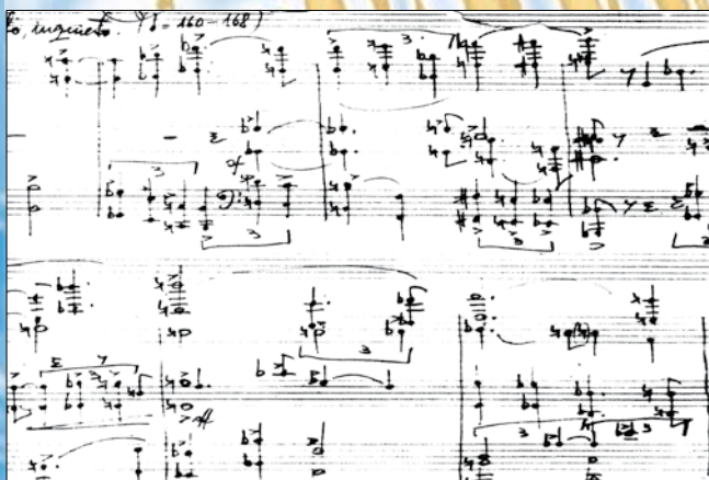
Partitúra z opery Vzkriesenie

Zmyslom celého života Jána Cikkera bolo komponovanie, ktorým si získal čestné miesto v kontexte európskej hudobnej kultúry. Zomrel 21. 12. 1989 v Bratislave. V roku 2011 mu bolo udelené štátne vyznamenanie Rad Ľudovíta Štúra I. triedy in memoriam.