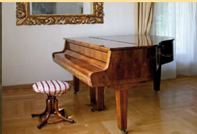
Expozície múzea Jána Cikkera v Bratislave